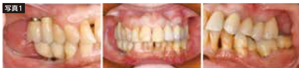
▲重症の歯周病の13年後の状態：歯周病は治り、メンテナンス期間中に1本の歯もインプラントも失っていない。2015年、ヨーロッパ歯周病学会(ロンドン)で市丸らが発表した。

アメリカ歯周病学会により、スウェーデンで1972〜2001年に375人を対象に行われたメンテナンスでは、30年間に抜ける歯は1人あたり0.6本でした。また、抜けた歯のほとんどは、虫歯の治療で神経を取った歯でした。このことから、正しい歯科メンテナンスを行うと何歳になっても自分の歯で食べられることが明らかとなりました。当院のメンテナンスでも実証しており、ヨーロッパ歯周病学会、